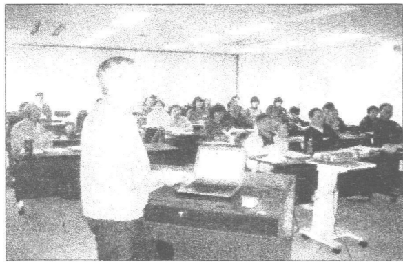
講義を熱心に聞く受講生