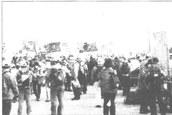
鎌倉海浜公園にて解散式